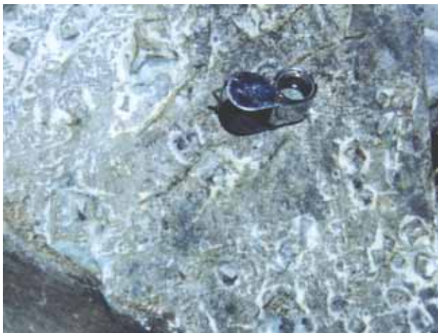
Figura 8 - Marcas de cubos de sais formados em estrato de grauvasca submetido à intensa evaporação.

pelíticos, sem orientação interna, confirma a hipótese de que os fragmentos líticos ainda não haviam sofrido metamorfismo quando foram retrabalhados.