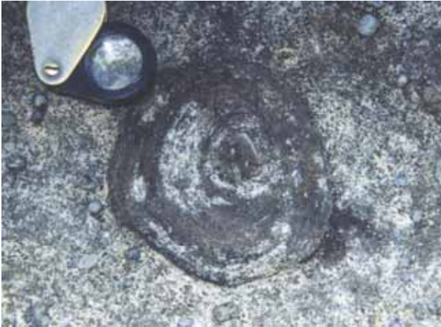
Figura 5A – Concreção carbonática que representa uma estrutura pós-deposicional formada por precipitação química. Nesse caso há contribuição de óxidos de ferro.

Figure 5A – Carbonate concretion formed by chemical precipitation in the diagenetic stage of the lithification. There is iron oxide contribution.