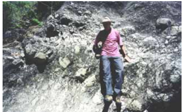
Figura 7 – Fácies de brecha intraformacional com blocos e calhaus de quartzitos associada a fácies de conglomerados maciços. Observar a natureza angulosa da maior parte dos clastos.

Essa fácies é maciça e, apenas localmente nas maiores exposições, pode-se observar um acamamento difuso ou feições erosivas na base de amplos canais.