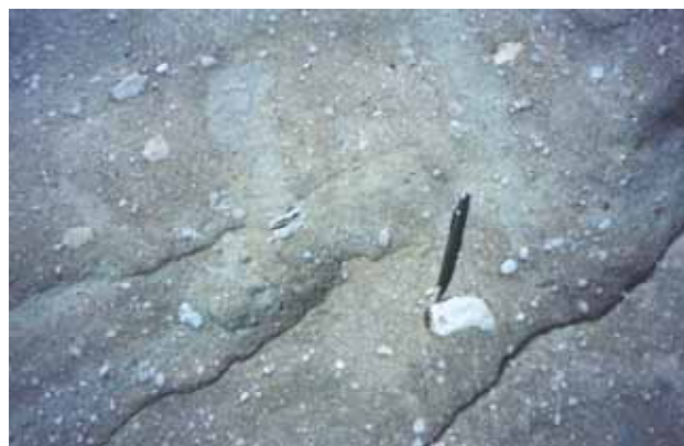
Figura 4 – Detalhe da fácies de conglomerado matriz-suportado que representa a rocha mais comumente observada no Vale da Lua.

milimétricos a decimétricos, sub-angulosos a sub-arredondados, com raros grãos bem arredondados ou bem angulosos, mostrando esfericidade média à baixa (Fig. 4). A rocha é matriz-suportada, sendo a matriz atualmente representada por uma mistura mal graduada de areia, silte e carbonatos. O carbonato ocorre na forma de cristais euhédricos e como uma massa pouco cristalina. Os cristais de carbonato mais grossos apresentam tons vermelhos a arroxeados.